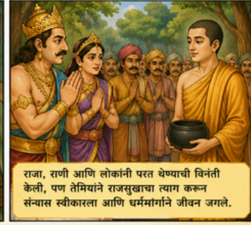
राजा, राणी आणि लोकांनी परत येण्याची विनंती केली, पण तेमियाने राजसुखाचा त्याग करून संन्यास स्वीकारला आणि धर्ममार्गाने जीवन जगले.

संदेश : वाईट कर्मांचे फळ भोगावेच लागते. सत्ता, पैसा क्षणभंगुर आहे. खरे सुख धम्मात आणि सदाचारात आहे.