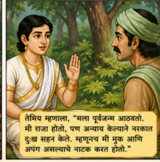
तेमिय म्हणाला, “मला पूर्वजन्म आठवतो. मी राजा होतो, पण अन्याय केल्याने नरकात दुःख सहन केले. म्हणूनच मी मूक आणि अपंग असल्याचे नाटक करत होतो.”