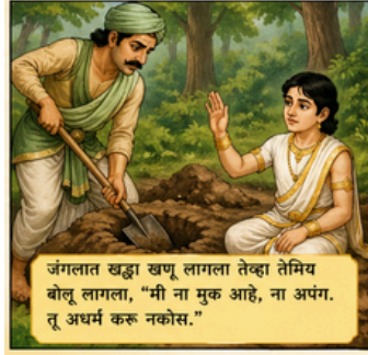
जंगलात खड्डा खणू लागला तेव्हा तेमिय बोलू लागला, “मी ना मूक आहे, ना अपंग. तू अधर्म करू नकोस.”