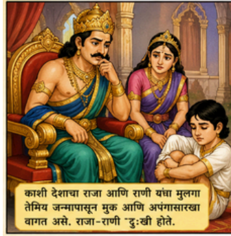
काशी देशाचा राजा आणि राणी यंचा मुलगा तेमिय जन्मापासून मूक आणि अपंगासारखा वागत असे. राजा-राणी दुःखी होते.