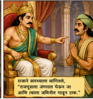
राजाने सारथ्याला सांगितले, “राजपुत्राला जंगलात घेऊन जा आणि त्याला जमिनीत गाडून टाक.”