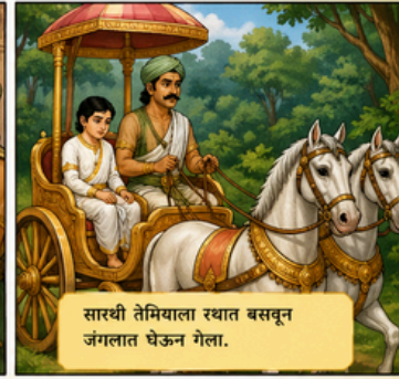
सारथी तेमियाला रथात बसवून जंगलात घेऊन गेला.